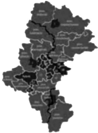
Rysunek 1. Historyczna granica pomiędzy Śląskiem a Małopolską 7

Antagonizm o szczególnym natężeniu dotyczący mieszkańców województwa śląskiego występuje między Górnoszlązakami i Zagłębiakami. Jego korzenie sięgają podziałów historycznych, w tym podziału wyznaczonego przez rzekę Brynicę (granica pomiędzy Śląskiem a Małopolską).