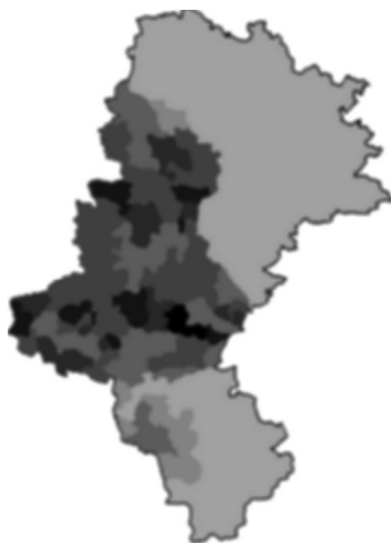
Rysunek 2. Ślązacy w województwie śląskim